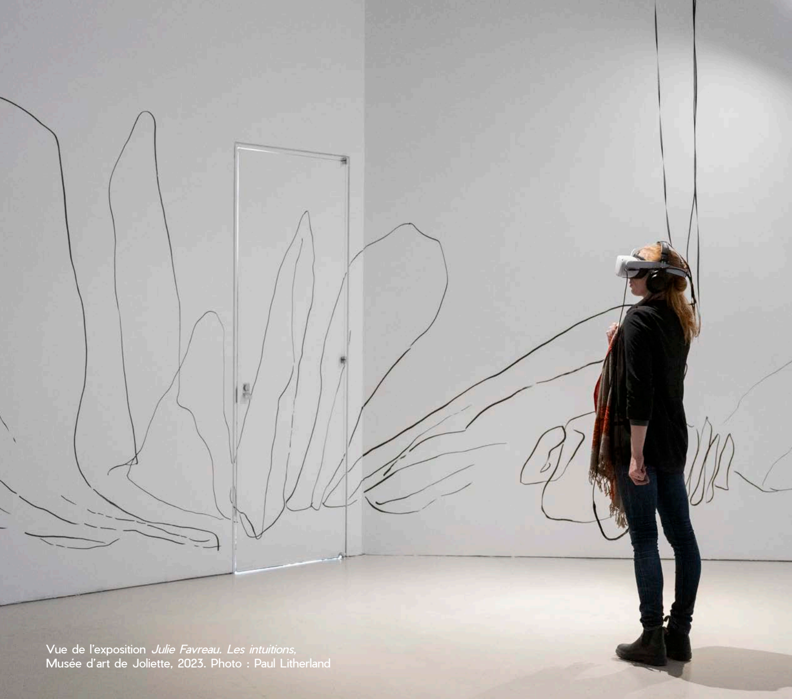
Vue de l'exposition Julie Favreau. Les intuitions , Musée d'art de Joliette, 2023.