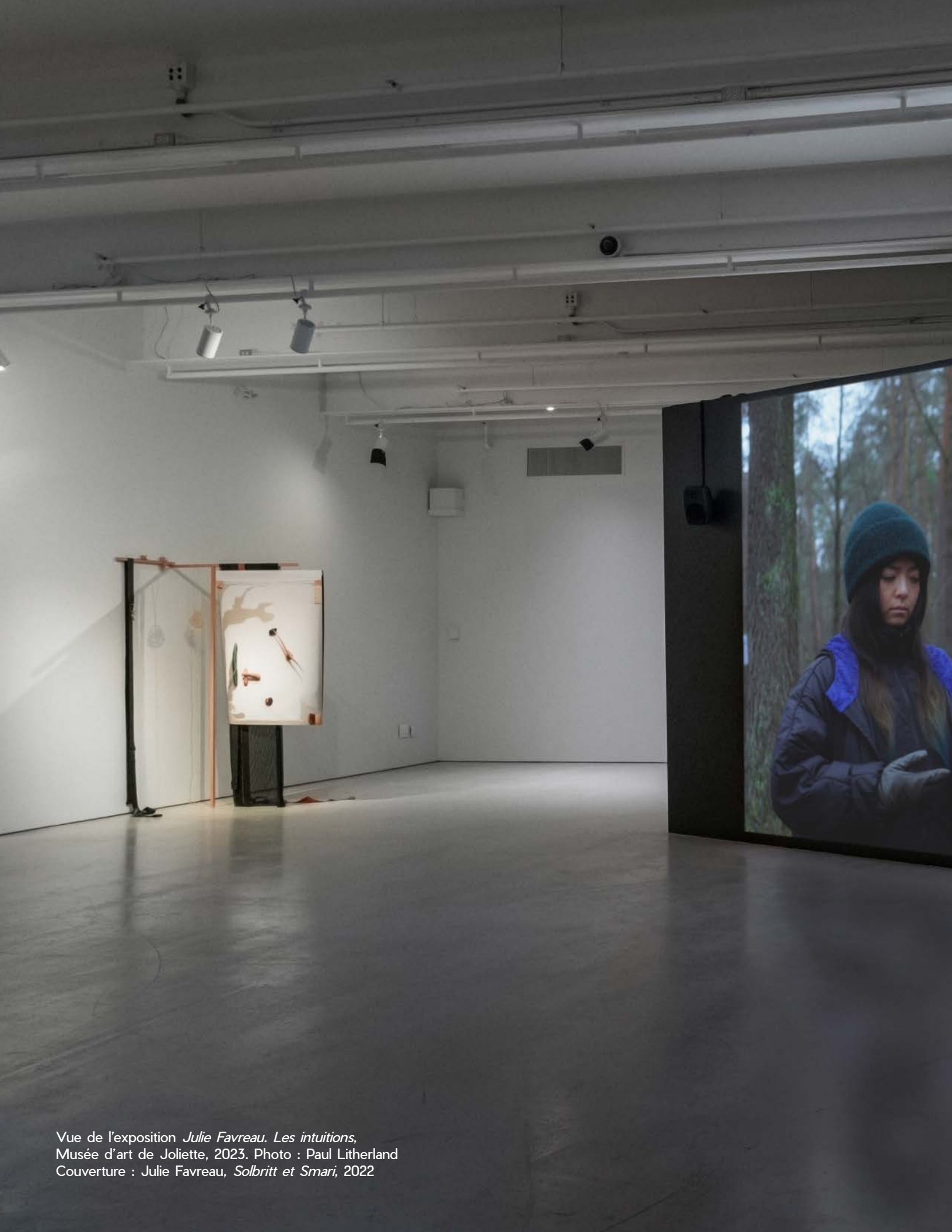
Vue de l'exposition Julie Favreau. Les intuitions , Musée d'art de Joliette, 2023. Couverture : Julie Favreau, Solbritt et Smari , 2022