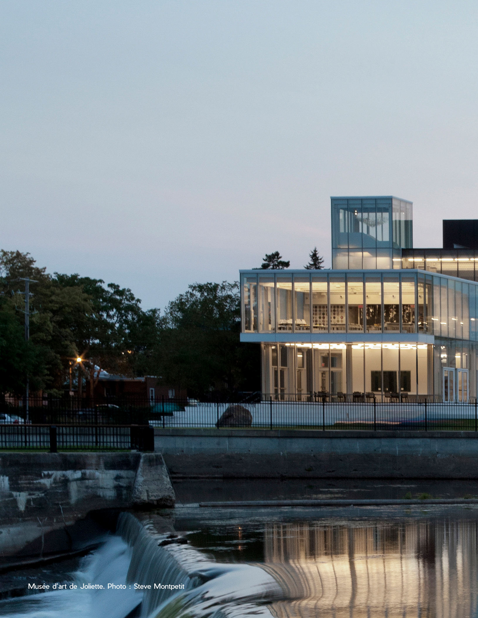
Musée d'art de Joliette.