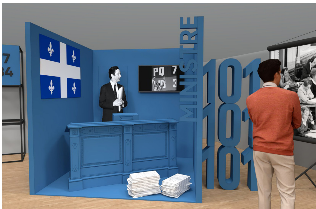
CAMILLE LAURIN / Ministre